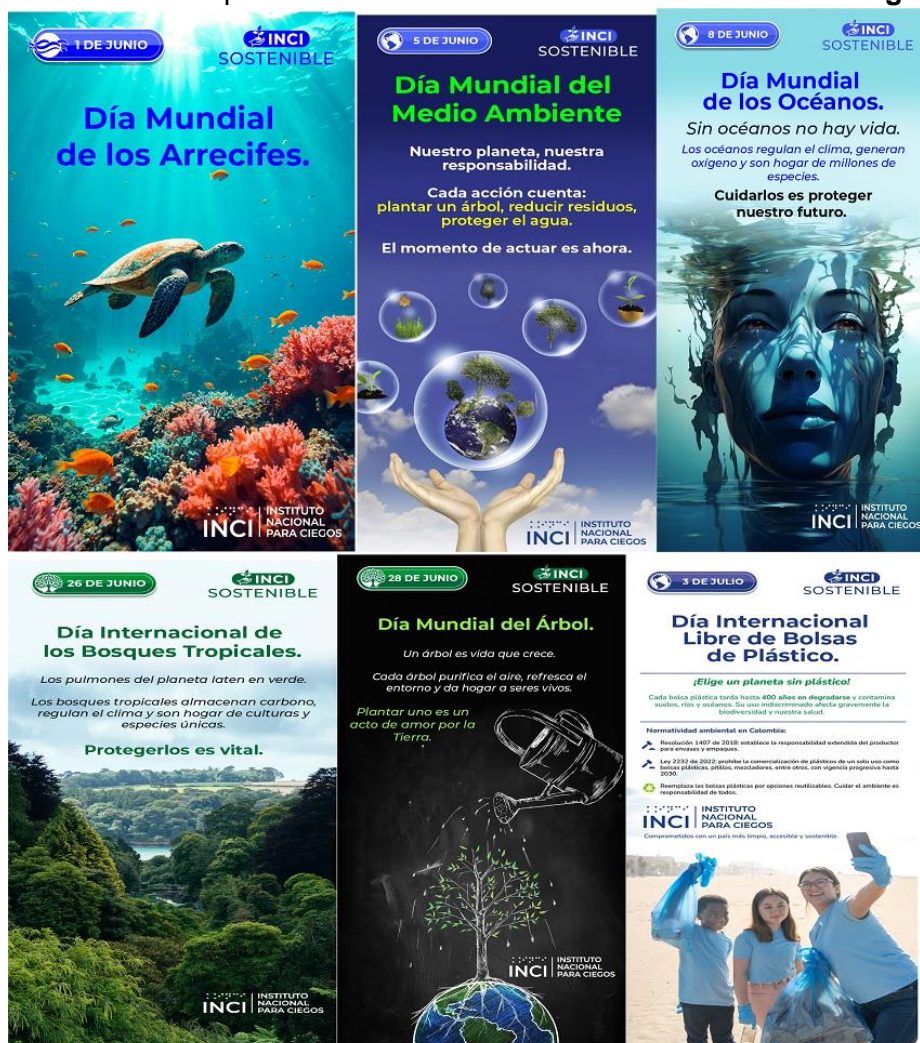
Imagen 1. Piezas graficas correspondientes al segundo trimestre, teniendo en cuenta el calendario ambiental.

El instituto nacional para ciegos, a través de la intervención de la oficina de financiera y medio ambiente, elabora calendario ambiental basado en el calendario propuesto por Ministerio de Ambiente y Desarrollo Sostenible con el fin de generar y publicar piezas graficas que generen la sensibilización a los funcionarios en cuanto al cuidado del medio ambiente, reducción en la generación de residuos aprovechables, ahorro y uso eficiente de agua, la reducción de los plásticos entre otros. Como se evidencia en la imagen 1 .